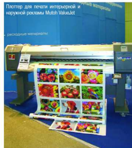
Плоттер для печати интерьерной и наружной рекламы Mutoh ValueJet

Рынок очень хорошо принял серию image-PROGRAF. Мы продали около сотни машин Canon iPF500. Что касается принтеров более высокой серии - 5000 и так далее - то по многим причинам я не могу похвалиться тем же. Между компаниями Canon и HP идет очень плотная конкурентная борьба. Последние полтора года оба производителя выводят новые модели, ориентированные на один рынок. Наша компания остается приверженцем решений, продвигаемых Canon. Я имею в виду двенадцатицветную печать, которая реализована во всех сериях. Также надо понимать, что это не то оборудование, которое можно продавать пачками. Клиенты и пользователи печатающих комплексов Canon - профессионалы в области печати. Цены адекватны тому, что пользователь получит при применении этих печатающих устройств. Могу с уверенностью заявить, что в настоящее время существует немало специалистов, которые смогли оценить безусловное изощрение технической мысли, нашедшее воплощение в машинах Canon.