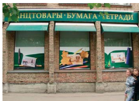
Оформление витрин магазина канцтоваров "Ликор"

и быстро выдает самые нежные полутона и яркие заливки на фотопостерах, пленках для мобильных стендов, а также бесконечные чертежи многочисленных студентов... Но водные чернила, которые текут, если вода попадает на плакат, значительно ограничивали применение изображений, отпечатанных на этом плоттере.