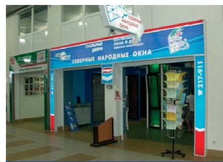
Оформление пункта приема заказов фирмы "Северные народные окна"

На пробах с установками "Quality Mode" качество изображения получилось очень высоким на большинстве материалов: бумагах, баннерных тка-