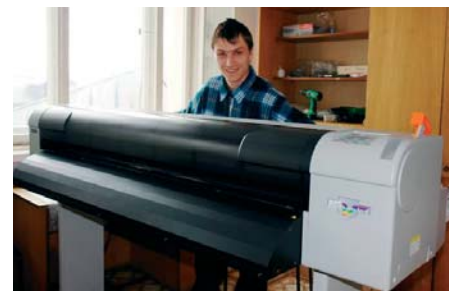
ValueJet 1204 в офисе агентства

Почувствовав необходимость иметь машину с еще более высоким качеством печати и достаточно высокой производительностью, мы приобрели плоттер компании Kodak – Encad Nova Jet 1000i, печатающий чернилами на водной основе. И уже пару лет с удовольствием наблюдаем, как этот замечательный аппарат легко